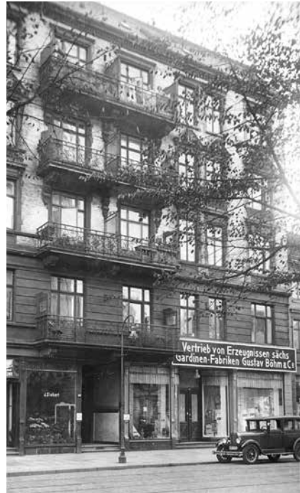
Das Haus von Familie Meldola 1927, damals Vierländer Straße 6a, heute Vierländer Damm 6